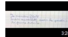
Haïkus floiracais 2017