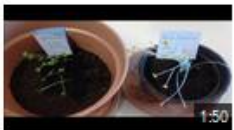
Graines de moutarde à Dijon