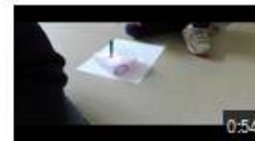
Thymio et le format A4