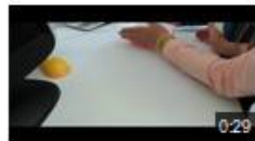
Thymio nous obéit