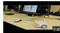
Comment arrêter Thymio ?