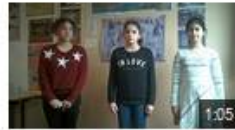
Lupus et Agnus