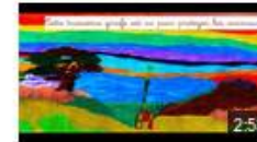
Les animaux de la savane