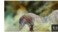
Poulpe Commun - Octopus Vulgaris