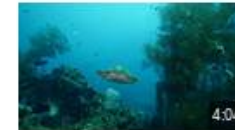
Tortue sur l'épave du Liberty