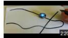
Ozobot et le code couleurs