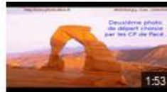
Les CP twittentenriment