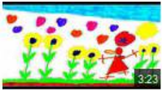
Notre Vilain Petit Canard