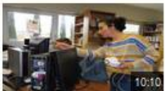
Codatge peus calandrons a Montpelhier