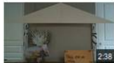
l'enlèvement de Proserpine