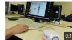
Thymio tourne en rond