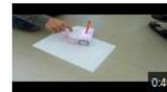
Les lunettes de Thymio