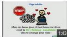
Histoire d'un logiciel AbulÉdu