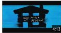
Castellum in colle