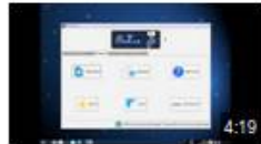
Présentation de PrimTux 2