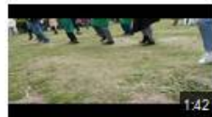
Madison en Pujolais