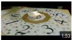
La roue de la fortune