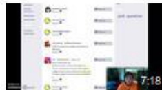
tutoriel babytwit : créer un compte et rejoindre un groupe