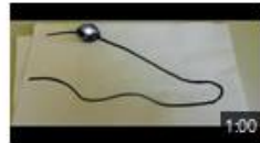
Premiers pas avec Ozobot